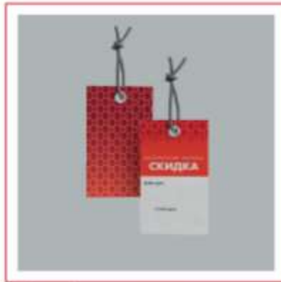
Ценник бирка с отверстием