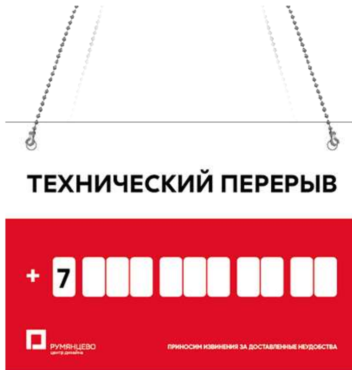
Вариант на цепочке (ПВХ 5мм)