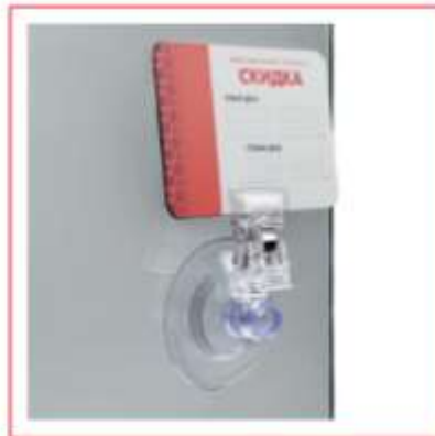
Зажим ценника двухлопастный на силиконовой присоске