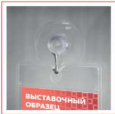
Присоска силиконовая с крючком для ценников