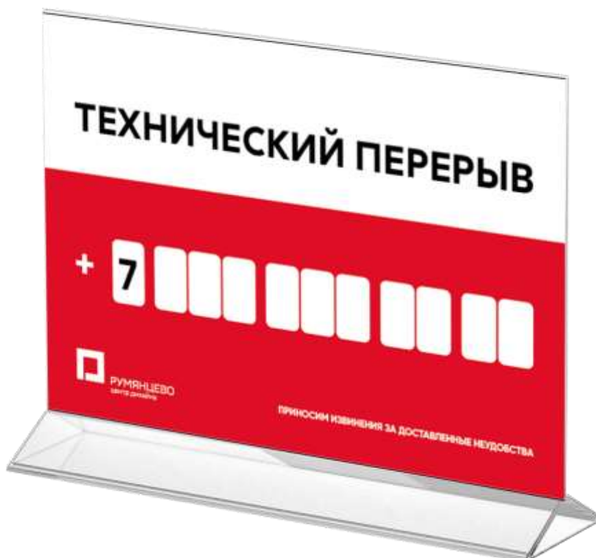
Вариант настольный. Размещение в тейбл-тенге (А4)