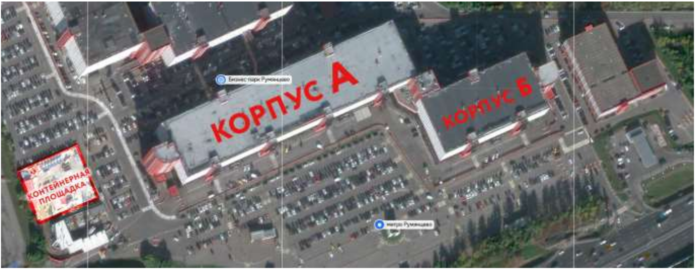
СХЕМА место расположения контейнерной площадки для сбора отходов